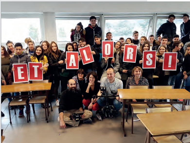
Photo Messidor Classe de 1 ère BAC Pro Commerce - Institution Robin

Président des Couleurs de l'Accompagnement