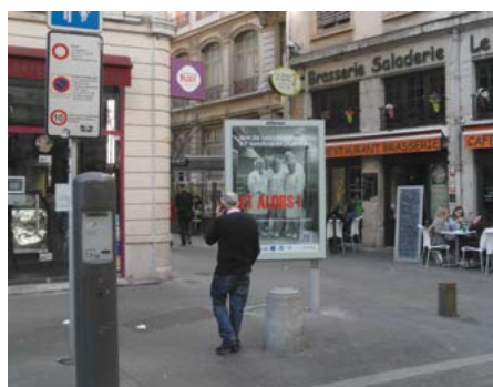
Lyon mars 2014

Nouvelles Couleurs sera rédigé trois fois par an et proposera, à chaque fois, un dossier concernant l'accompagnement du handicap psychique.