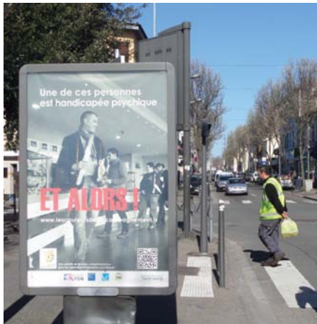
Saint-Fons mars 2014

Si l'on se réfère aux études de l'OMS qui les nomment maladie du XXI e siècle, les maladies psychiques toucheront bientôt un quart de la population mondiale. Elles concerneront un