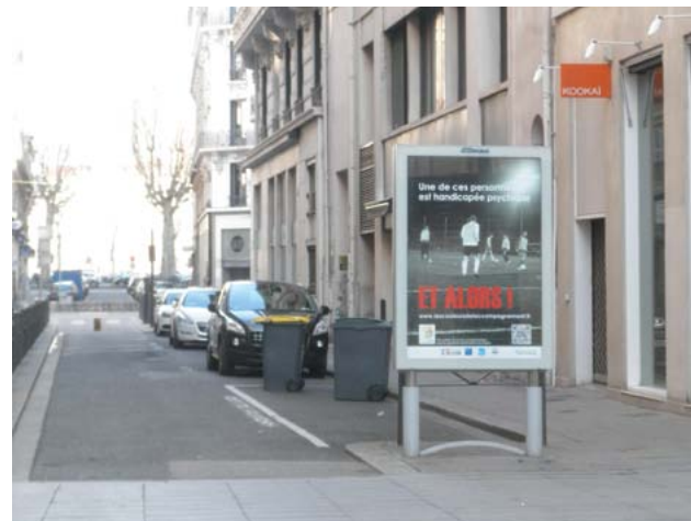
Lyon mars 2014

que les psychiatres auraient à tort laissé sortir. Cette image inquiétante ne rend évidemment pas compte de la réalité et dans la réalité, les malades psychiques sont plus souvent victimes que bourreaux. Mais surtout, en répandant la peur ou le mépris du malade mental, elle isole les malades, ajoute la souffrance de la stigmatisation et de l'exclusion à leurs difficultés. Aussi, certains vivent-ils leur maladie dans la honte, alors que d'autres la déniaient tant les conséquences leur font peur !